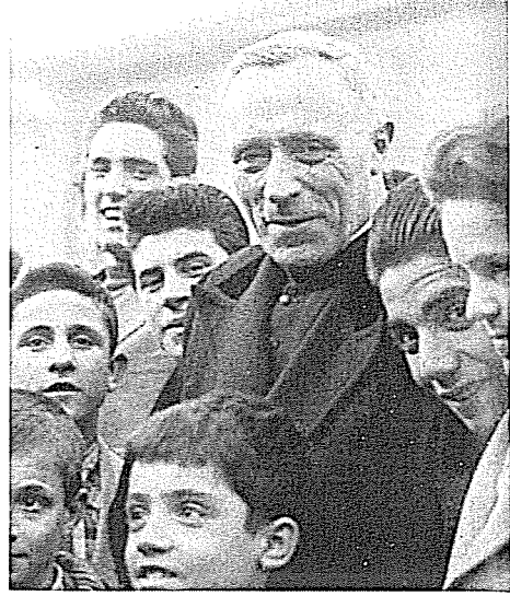
↑ La sua paterna passione per i giovani.