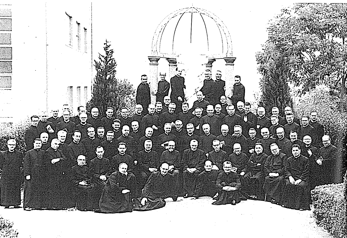
↓ Esercizi Spirituali a Muzzano per direttori e parroci.