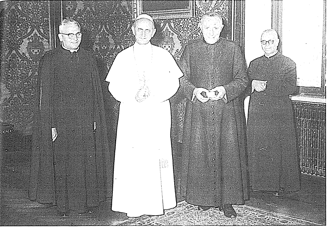
↑ Incontro con Paolo VI, Castelgandolfo, 1963.